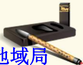
中国城乡互联网普及率