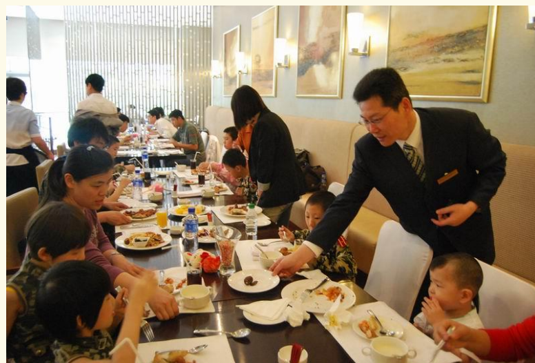
西装与西餐传入中国